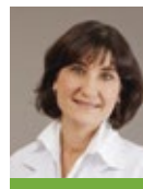
Pr Claire Mounier-Vehier

Dire non au tabac, avoir une alimentation équilibrée et faire de l'exercice tous les jours : c'est ainsi qu'il est possible de vivre mieux plus longtemps.